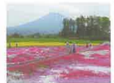
外出レクリエーション(倶知安)