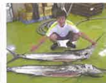
産地直送メニュー