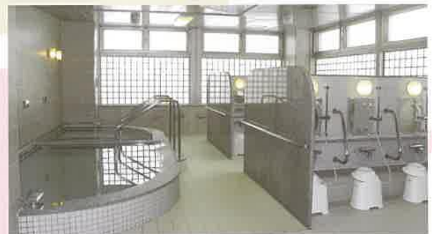
大浴場 開放感あふれる大浴場。湯ったり、のんびり、お過ごしください。