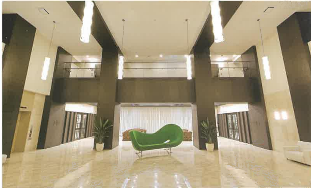
エントランスホール ホテルをイメージした、吹抜のあるエントランスホール。