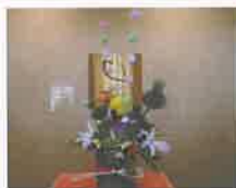
フラワーアレンジメント教室