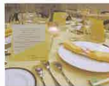
フレンチディナー