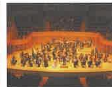
礼響 in Kitara