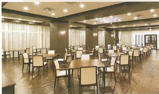
食堂 栄養士が考えた健康献立で1日3食、365日、食事の心配が無用です。旬をとり入れた季節のメニューをぜひお楽しみください。