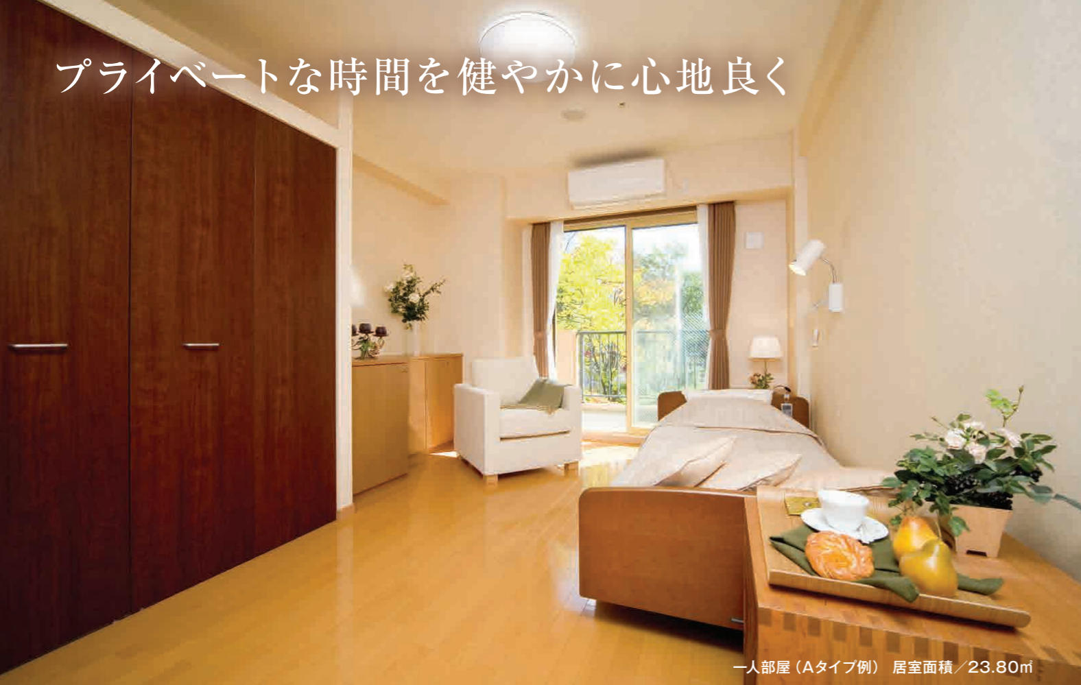
一人部屋（Aタイプ例） 居室面積 / 23.80㎡