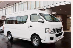
福祉車両参考写真

協力医療機関への送迎や入院中の肌着、寝巻き、タオルなどの洗濯物のお届けなど、様々なサポートを行う福祉車両(車いす対応)をご用意しています。