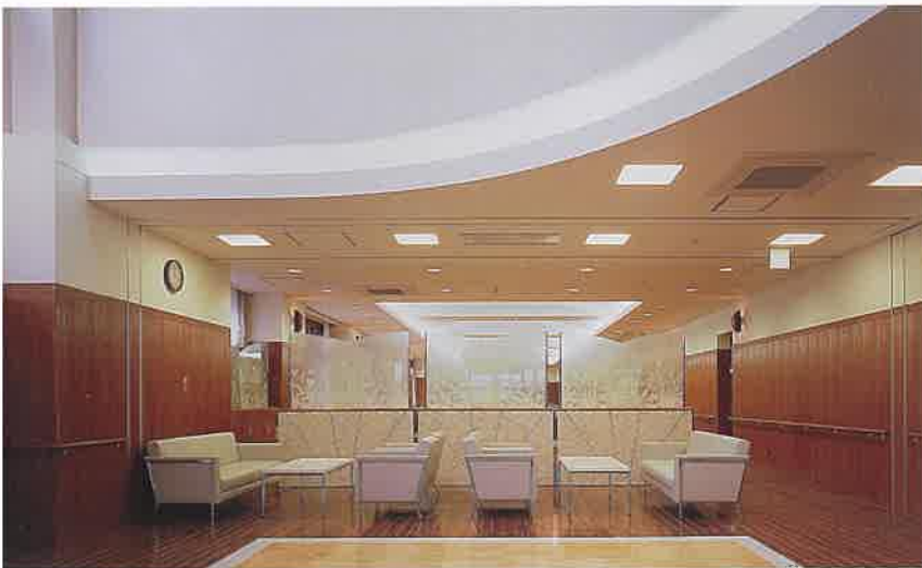
エントランスホール ホテルをイメージした、吹き抜けのあるエントランスホール。

約13畳のリビングに、収納もたっぷりとおふたりの悠々ライフにふさわしいゆとり空間。