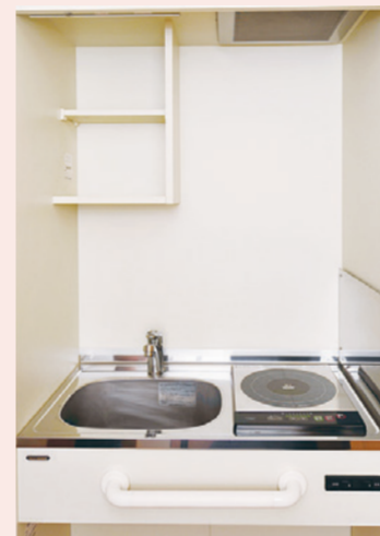
火を使わない安全なIHコンロを装備