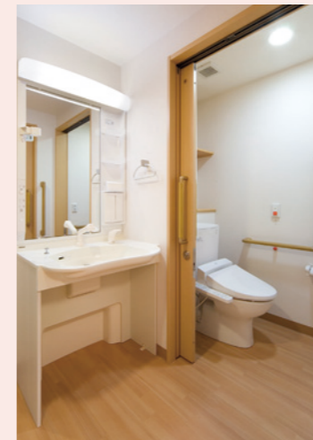
車椅子でも使いやすいトイレと洗面台