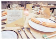
フレンチディナー