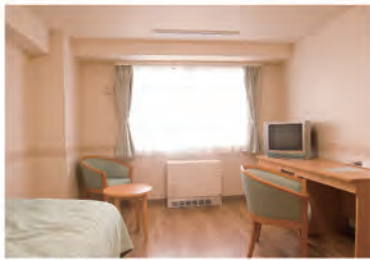
1ルーム Aタイプ(ゲストルーム)