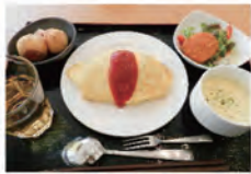
シェフオムライス