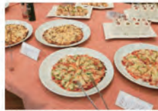
ピッツアバイキング