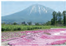
外レク(ニセコ・倶知安・京極)